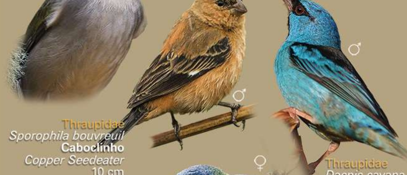
Thraupidae Sporophila bouvreuil Caboclinho Copper Seedeater 10 cm