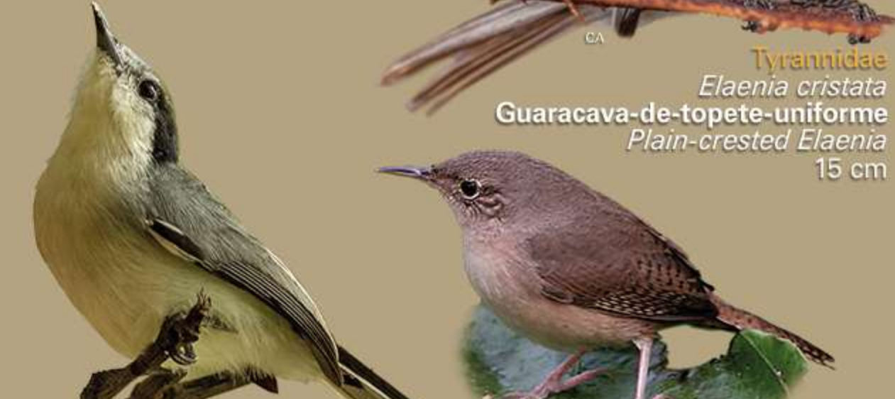
Poliopitidae Poliopitila atricapilla Balança-rabo-do-nordeste White-bellied Gnatcatcher 13 cm