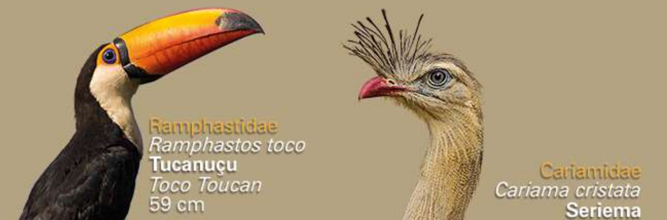
Ramphastidae Ramphastos toco Tucanuçu Toco Toucan 59 cm