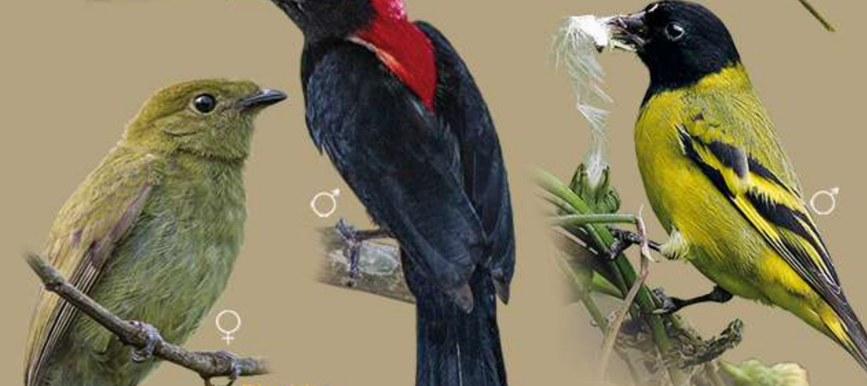
Pipridae Antilophia galeata Soldadinho Helmeted Manakin 14 cm