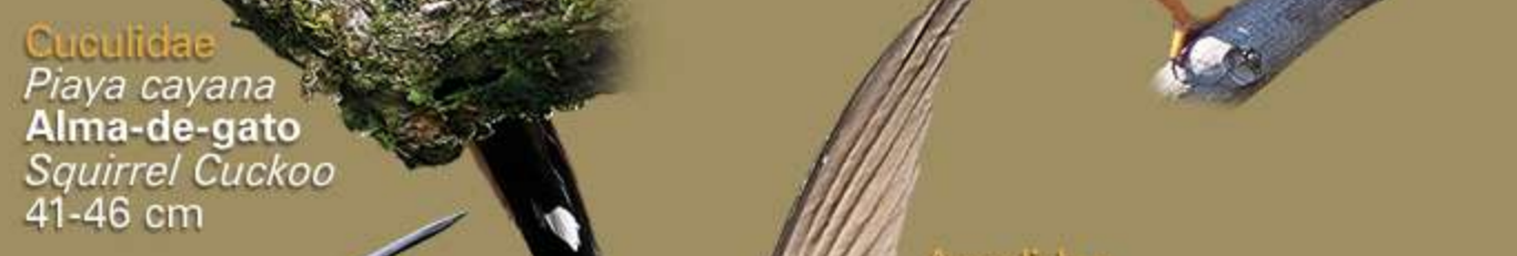
Cuculidae Piaya cayana Alma-de-gato Squirrel Cuckoo 41-46 cm