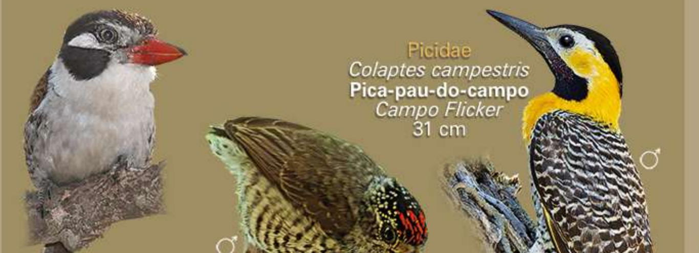
Picidae Colaptes campestris Pica-pau-do-campo Campo Flicker 31 cm