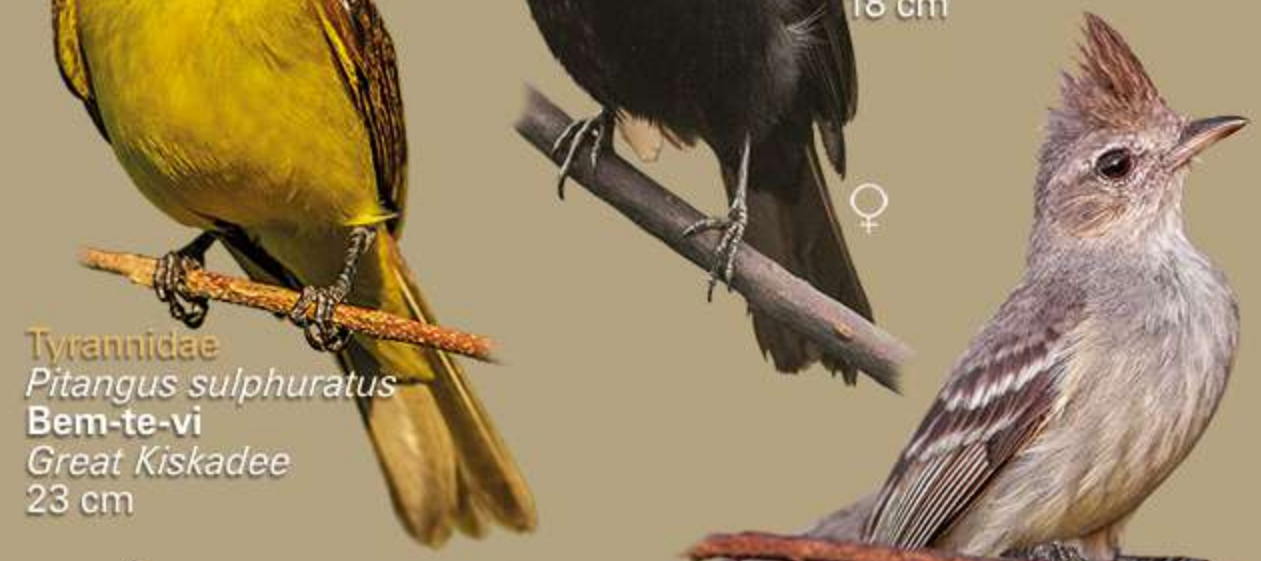
Tyrannidae Pitangus sulphuratus Bem-te-vi Great Kiskadee 23 cm