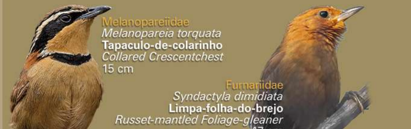
Melanopareidae Melanopareia torquata Tapaculo-de-colarinho Collared Crescentchest 15 cm