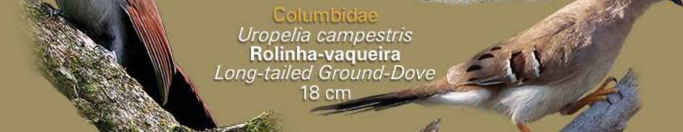
Columbidae Uropelia campestris Rolinha-vaqueira Long-tailed Ground-Dove 18 cm