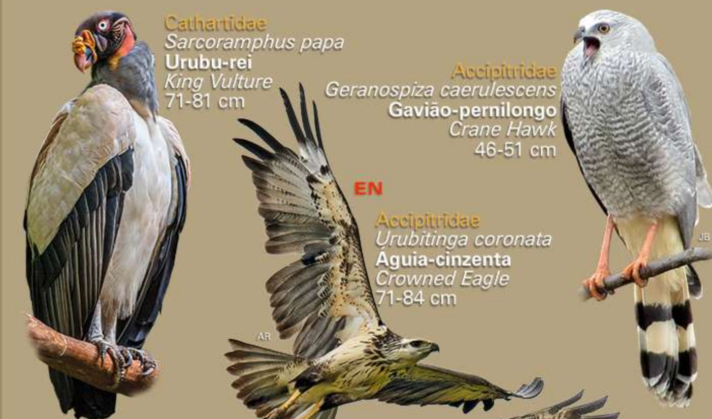
Cathartidae Sarcoramphus papa Urubu-rei King Vulture 71-81 cm