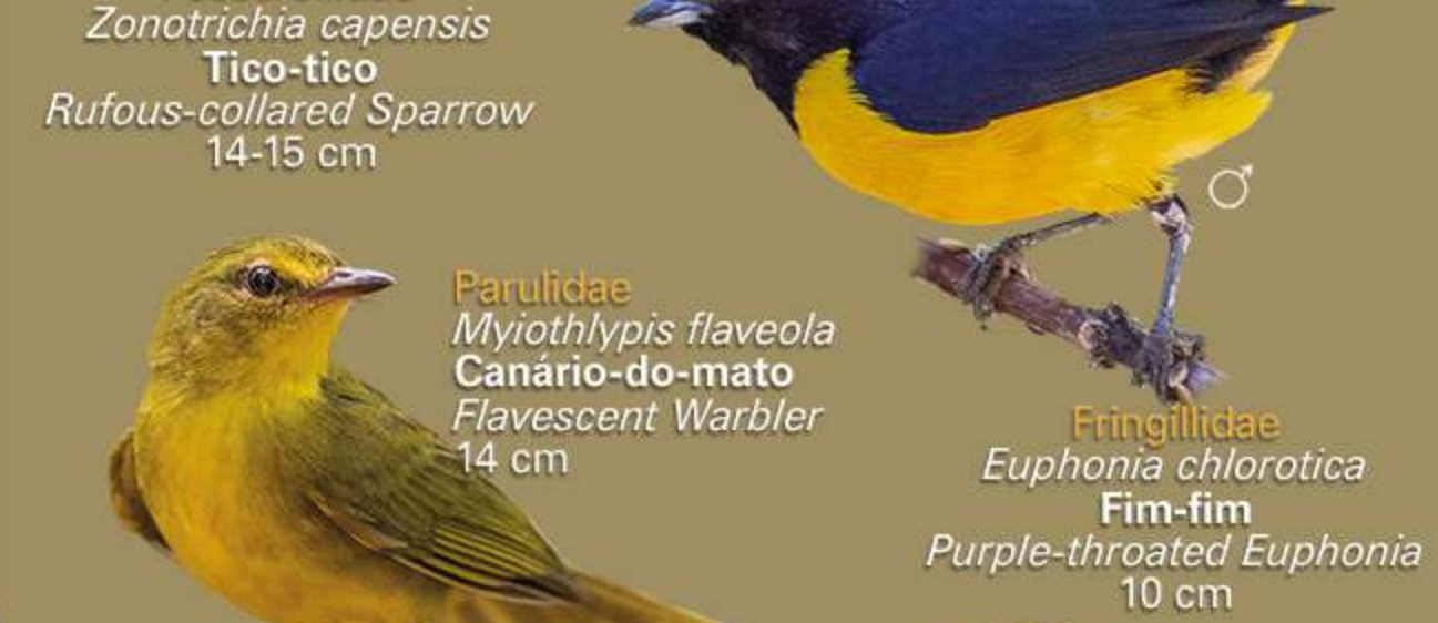
Parulidae Myiothlypis flaveola Canário-do-mato Flavescent Warbler 14 cm