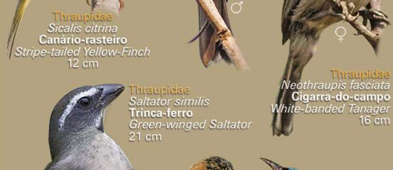
Thraupidae Sicalis citrina Canário-rasteiro Stripe-tailed Yellow-Finch 12 cm