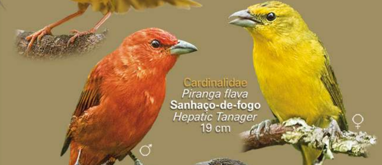
Cardinalidae Piranga flava Sanhaço-de-fogo Hepatic Tanager 19 cm