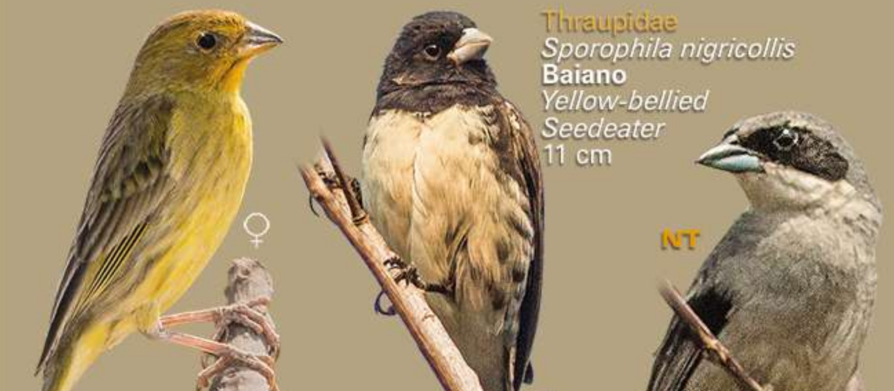
Thraupidae Sporophila nigricollis Baiano Yellow-bellied Seedeater 11 cm