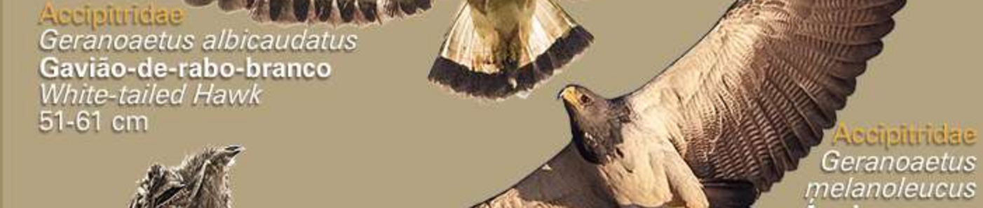
Accipitridae Geranoaetus albicaudatus Gavião-de-rabo-branco White-tailed Hawk 51-61 cm