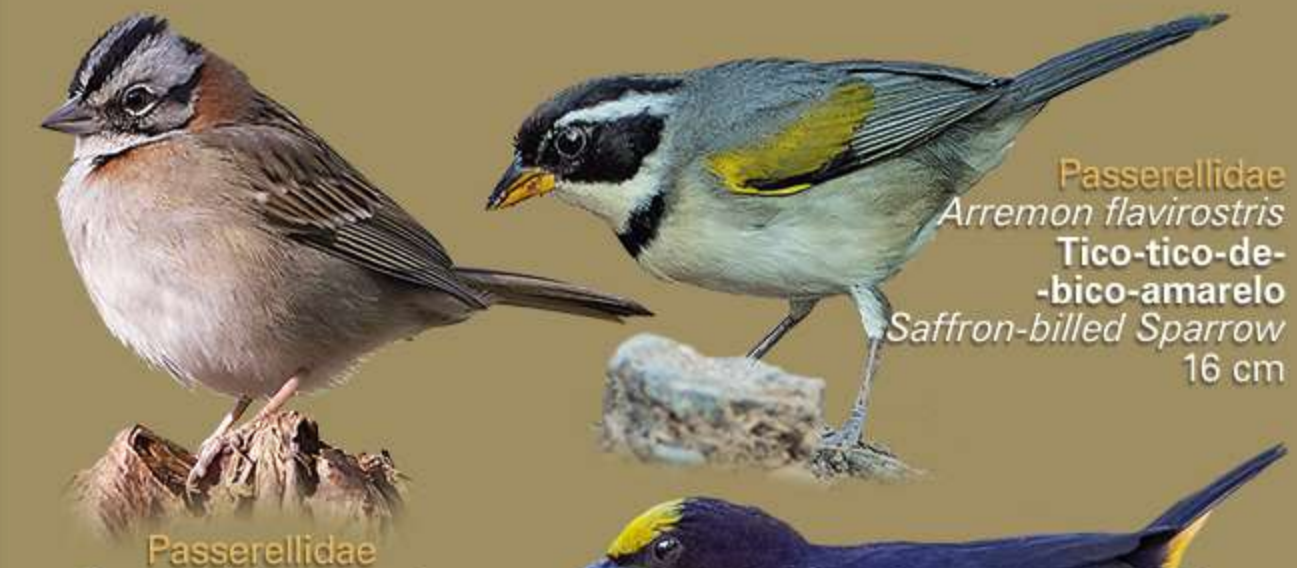
Passerellidae Arremon flavirostris Tico-tico-de-bico-amarelo Saffron-billed Sparrow 16 cm