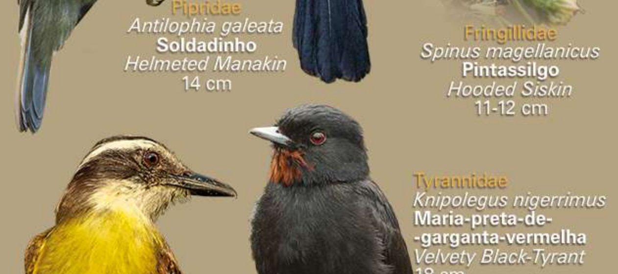
Tyrannidae Knipolegus nigerrimus Maria-preta-de-garganta-vermelha Velvety Black-Tyrant 18 cm