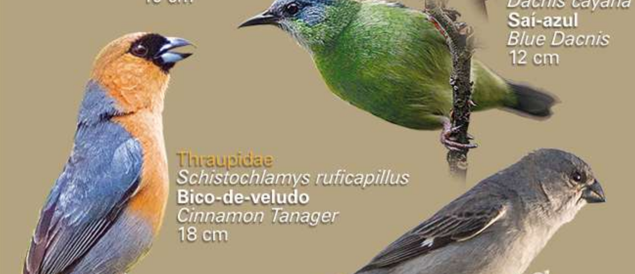
Thraupidae Schistochlamys ruficapillus Bico-de-veludo Cinnamon Tanager 18 cm