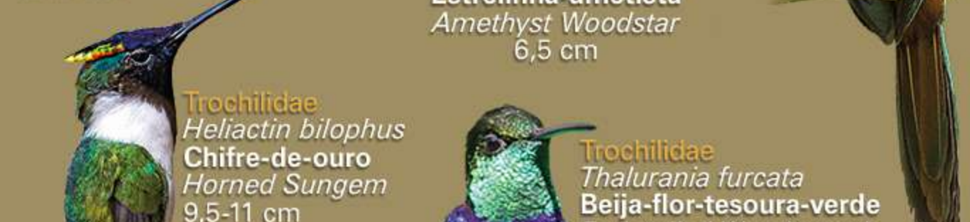
Trochilidae Heliactin bilophus Chifre-de-ouro Horned Sungem 9,5-11 cm