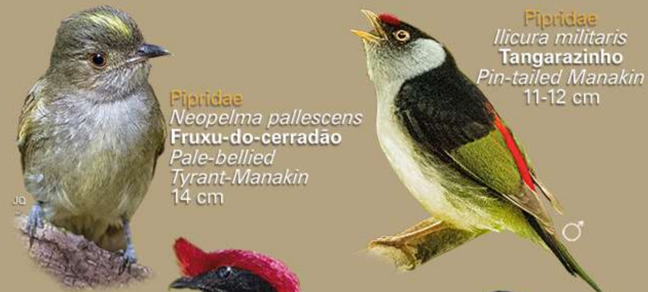
Pipridae Neopelma pallescens Fruzu-do-cerrado Pale-bellied Tyrant-Manakin 14 cm