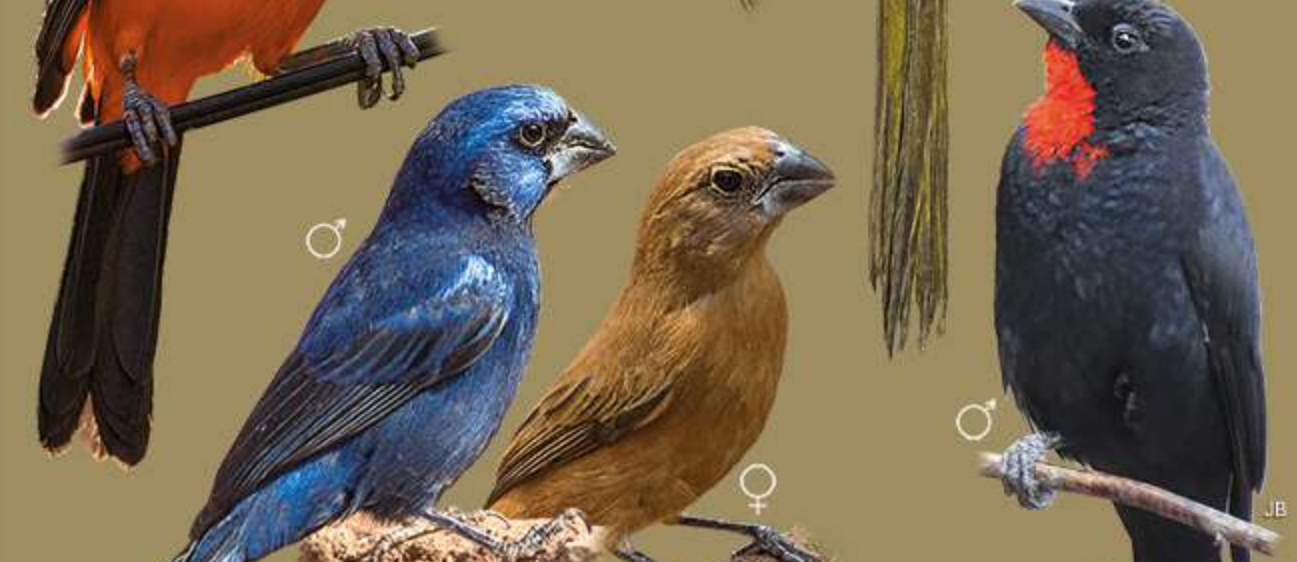
Cardinalidae Cyanoloxia brissonii Azulão Ultramarine Grosbeak 16 cm