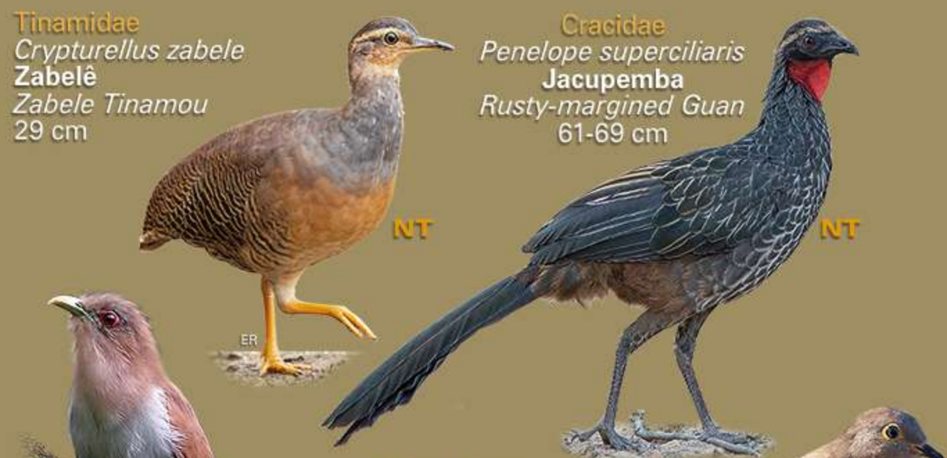
Tinamidae Crypturellus zabele Zabelê Zabele Tinamou 29 cm